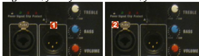
Fig. 5 Højttaler jukebox: Højttaler karaoke:

Når alle højttalere er forbundet, spiller jukeboxen med alle 4 højttaler og karaoke spiller stadig kun med 2 højttaler.